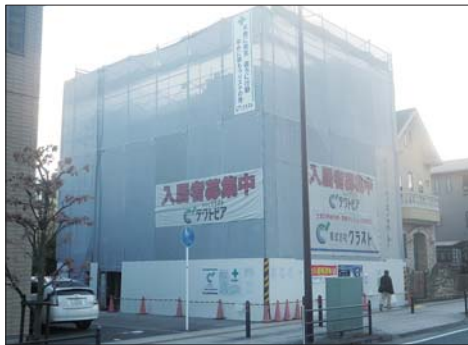
相模原市緑区西橋本／テルミエール